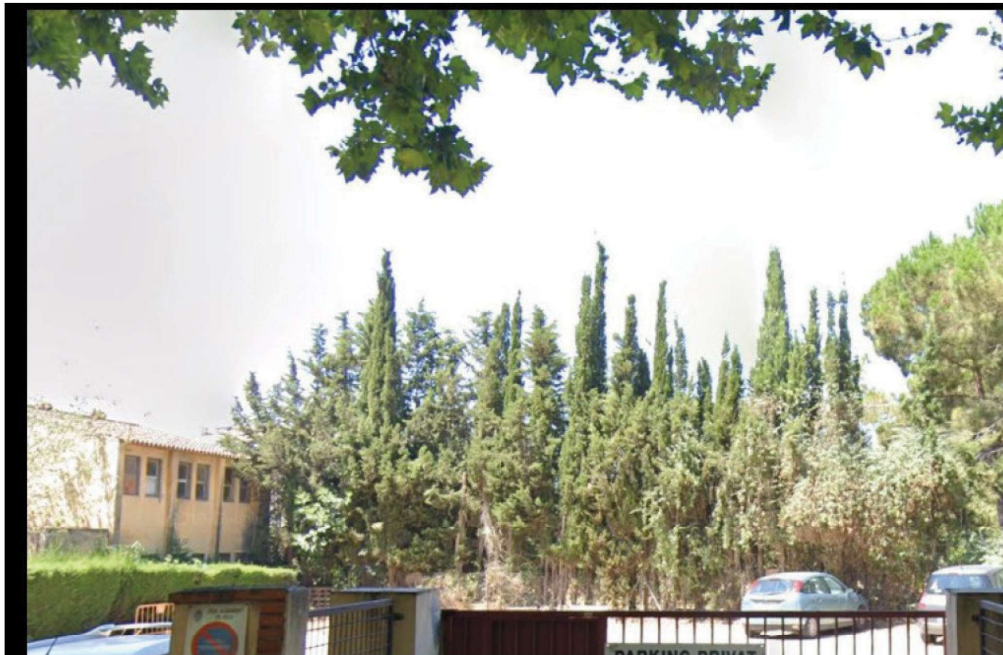
Fotografia 4C (extreta de Google juliol 2019) Illa 4. Vista des de Avinguda Països Catalans, Aparcament d'Unió de Pagesos, al fons tanca de xiprers stricta ( arbreda 4 ) i a la dreta Pi pinyer ( arbre 10 ).

LLUITA INTEGRADA I ASSESSORIA SL Tels: 977 79 19 85 – 609 27 98 55 sanitatvegetal@sanitatvegetal.com