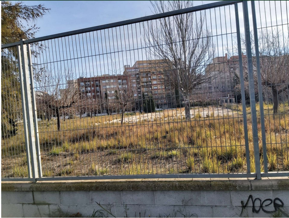
Fotografia 2 Illa 2: pati escola tancat, arbres diversos: moreres ( arbre 2 ), mèlies( arbre 3 ), àlbers ( arbre 12 ), xiprers ( arbre 5 ) al fondo

Aquest document és una còpia autèntica del document electrònic Ref. 14614742704617404373