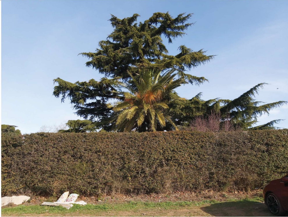
Fotografia 10 , al carrer Argentera, Illa 4: cedre ( arbre 9 ) i palmera canària ( arbre 8 )

LLUITA INTEGRADA I ASSESSORIA SL Tels: 977 79 19 85 – 609 27 98 55 sanitatvegetal@sanitatvegetal.com