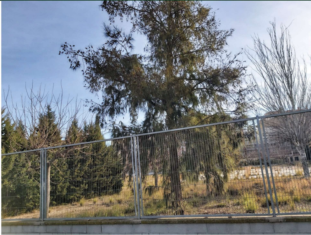
Fotografia 3A , Illa 2: pati escola tancat, arbres diversos: esquerra tanca xiprers ( arbreda 3 ), centre casuarina ( arbre 4 ), dreta àlber ( arbre 12 )