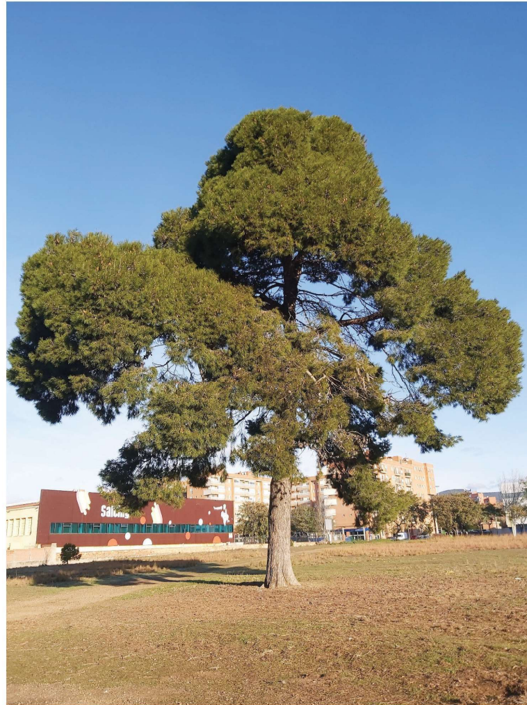
Fotografia 1 Pi blanc Pinus halepensis (arbre 1) Illa 1

LLUITA INTEGRADA I ASSESSORIA SL Tels: 977 79 19 85 – 609 27 98 55 sanitatvegetal@sanitatvegetal.com