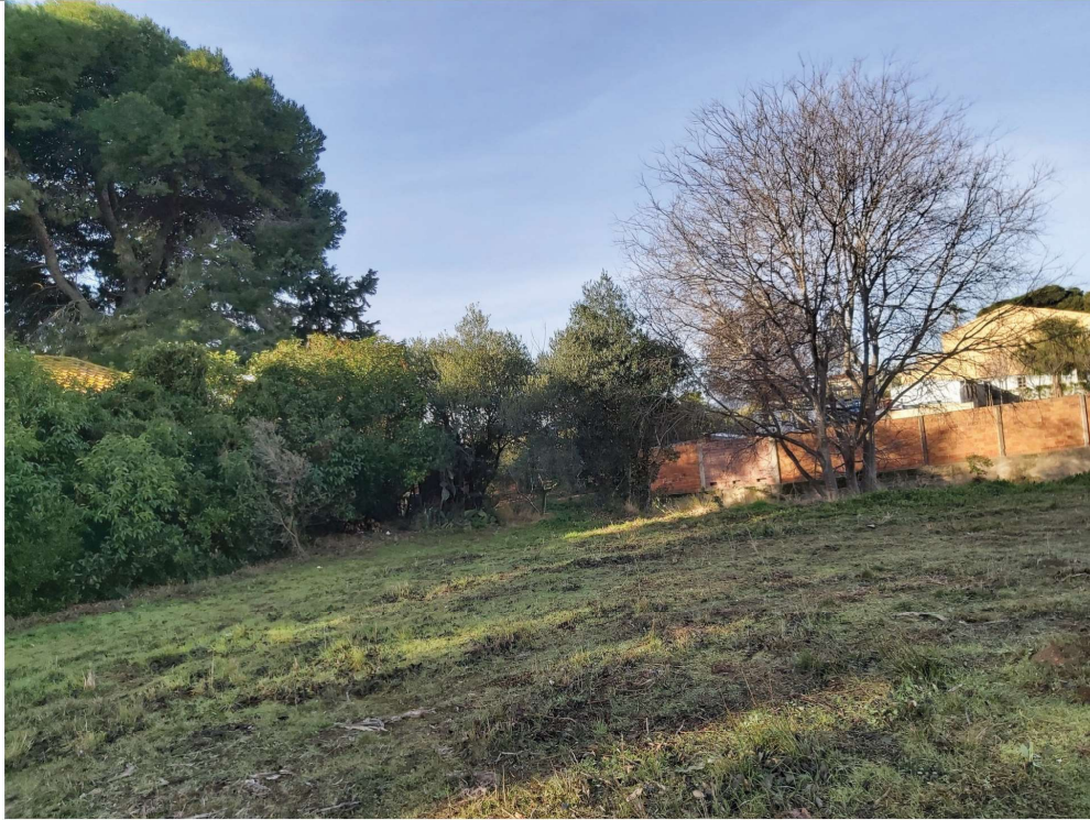
Fotografia 7 , Illa 3: esquerra pins blancs ( arbrada 1 ), ullastres al centre i lledoners ( arbre 11 ), per darrera hi ha el barranc. Continuació del tram de Vial D que es deixa com a Reserva Vial

Aquest document és una còpia autèntica del document electrònic Ref. 14614742704617404373