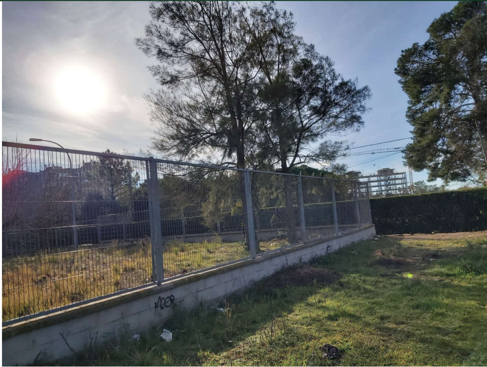
Fotografia 3B , Illa 2: pati escola tancat, arbres diversos: centre casuarines ( arbre 4 ), dreta pi blanc ( arbre 1 )

Aquest document és una còpia autèntica del document electrònic Ref. 14614742704617404373