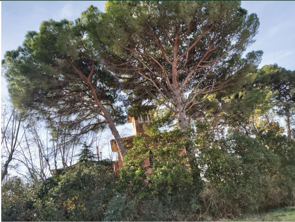
Fotografia 5, Illa 3: Xalet que es conserva, pins blancs ( arbreda 1 ), a l'esquerra copes sense fulles de plàtans d'ombra ( arbre 7 )

Aquest document és una còpia autèntica del document electrònic Ref. 14614742704617404373