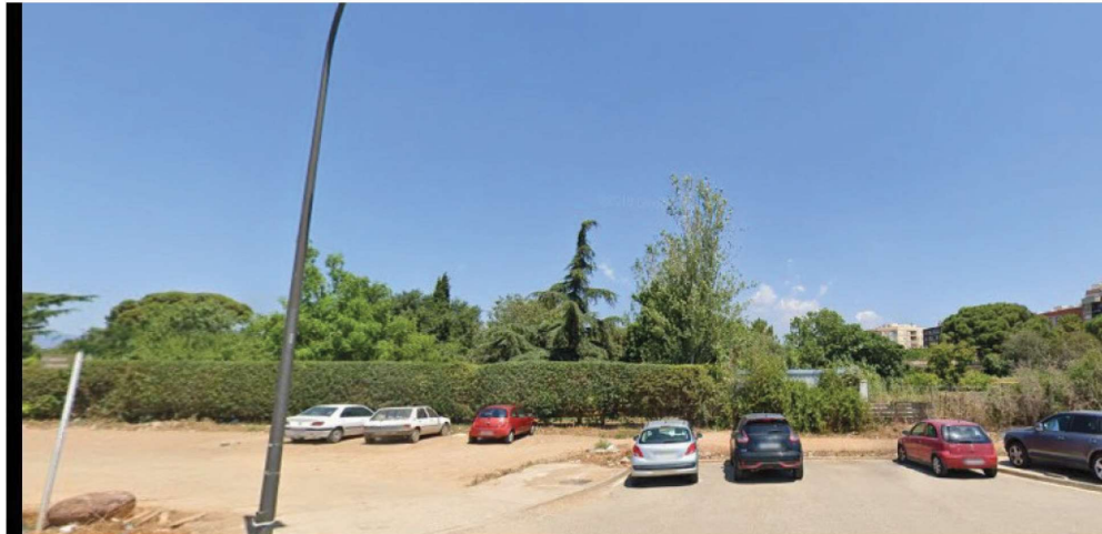
Fotografia 11A (cxtreta de Google juliol 2019) cruïlla carrers Argentcra i Romani, Illa 4, al centre cedre ( arbre 9 ) i a la seva dreta àlber ( arbre 12 ), aquests dos queden dins de la zona de equipaments. A l'esquerra del cedre, al fondo, sobresurt el xiprer stricta ( arbre 5 ) que seria l'arbre més alt del Pla. A la dreta, al fons, el pi pinyer ( arbre 10 ).