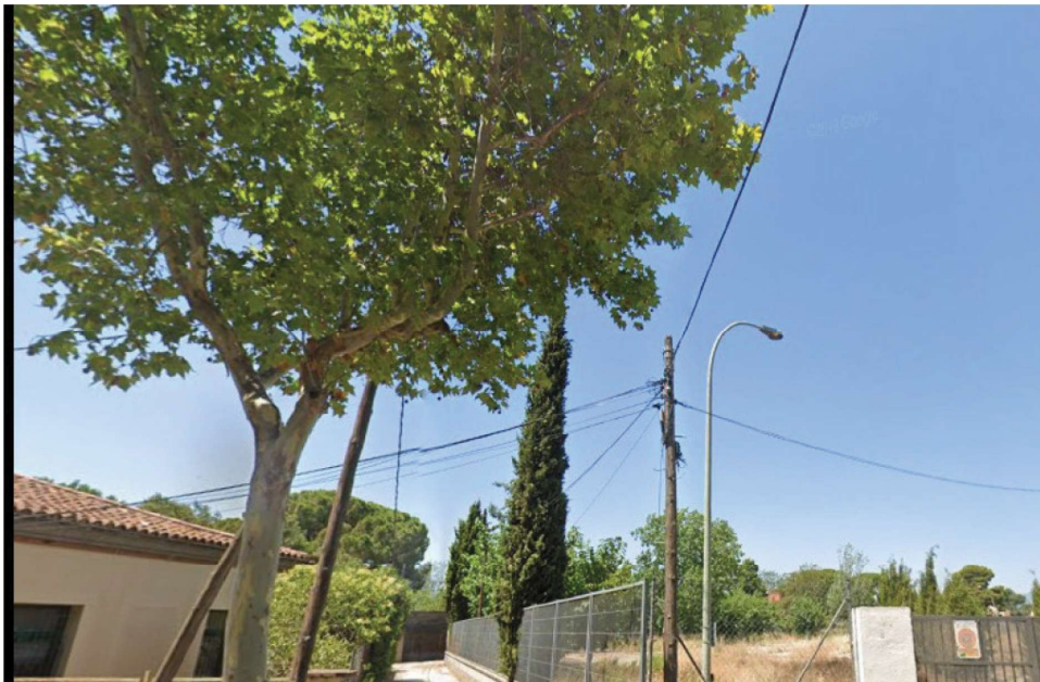
Fotografia 4A (extreta de Google juliol 2019) Illes 2 ( a la dreta) i 4, vista des de l'Avinguda Països Catalans, entrada al passatge, alineació de xiprers stricta ( arbre 5 ) al passatge, al fons Pi pinyer ( arbre 10 ).

LLUITA INTEGRADA I ASSESSORIA SL Tels: 977 79 19 85 – 609 27 98 55 sanitatvegetal@sanitatvegetal.com