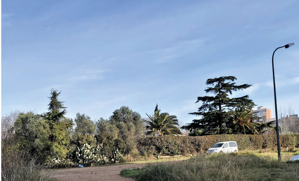
Fotografia 8 al carrer Argentera, Illa 3 i 4: esquerra i dreta cedres ( arbre 9 ), al centre i dreta palmeres canàries ( arbre 8 ) a l'esquerra queda el barranc. Per damunt de la palmera central sobresurt l'arbre més alt del Pla, un xiprer stricta ( arbre 5 ).

Aquest document és una còpia autèntica del document electrònic Ref. 14614742704617404373