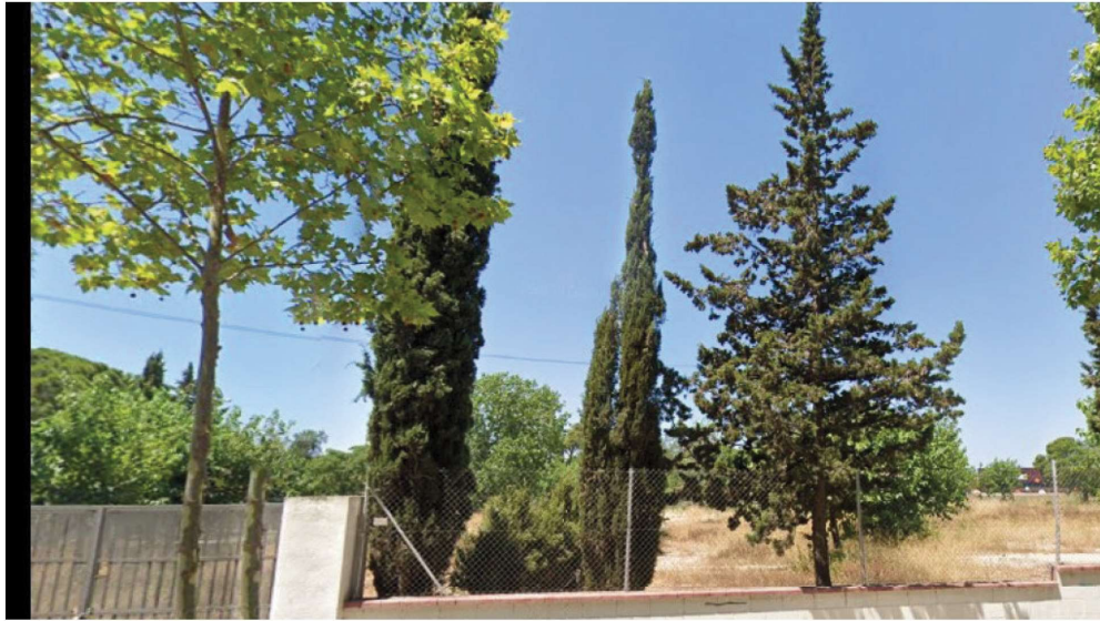
Fotografia 4B (extreta de Google juliol 2019) Illa 2 vista des de Avinguda Països Catalans, a la dreta de l'entrada passatge, alineació de 2 xiprers stricta i un horizontalis ( arbre 5 ) a la tanca, enmig dels dos stricta hi ha el tram final de la tanca de xiprers ( arbrada 3 ).