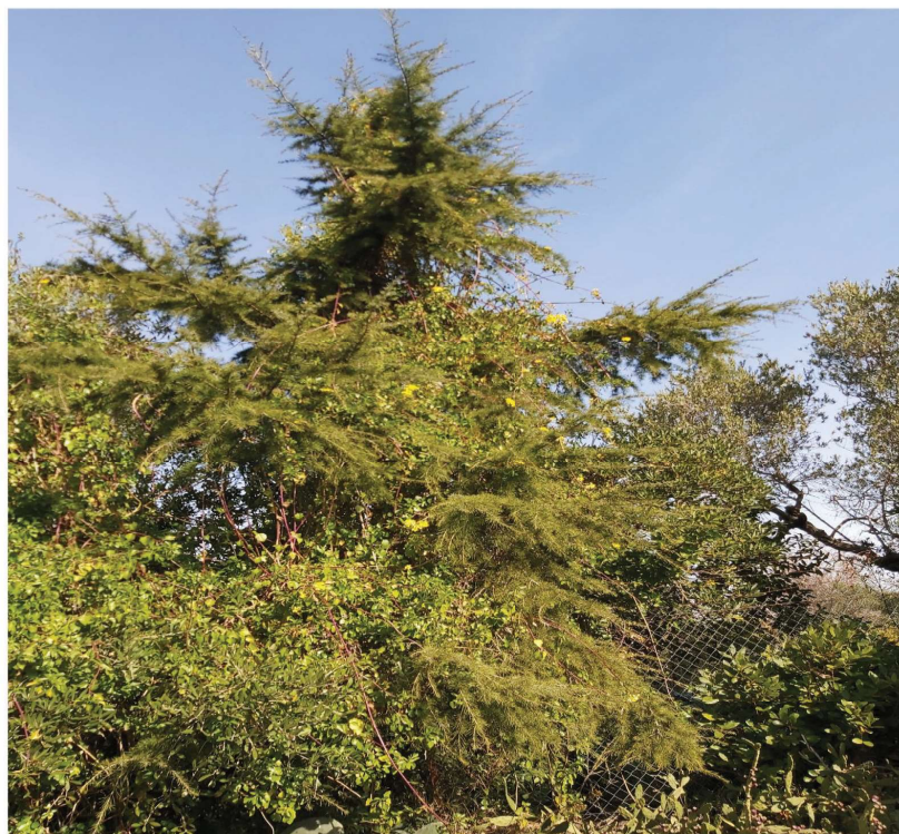
Fotografia 9 al carrer Argentera, Illa 3 : cedre cobert enfiladisses ( arbre 9 )